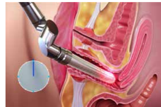
Der FemiLift-Behandlungsaufsatz wird in die Vagina eingeführt und gibt kreisförmig von innen nach außen in mehreren Durchgängen intensive Laserpulse ab.